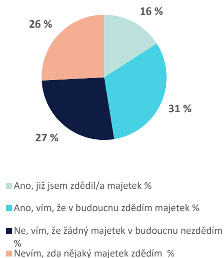
Předpoklad nabytí majetku formou dědictví

Každý třetí Čech očekává, že v budoucnu nabyde majetku formou dědictví, každý šestý Čech již v minulosti dědil. Vyplývá to z průzkumu poradenské Partners Banky, který proběhl letos v dubnu. Sběr dat byl realizován prostřednictvím aplikace Instant Research agentury Ipsos. Ve věkové kategorii 18–26 let (takzvané generace Z) předpokládá 40 % respondentů, že dědit bude, další necelá třetina si není jista. Že dědictví bude mít pozitivní vliv na jejich finanční situaci a potažmo i zabezpečení, předpokládá 6 z 10 potenciálních dědiců.